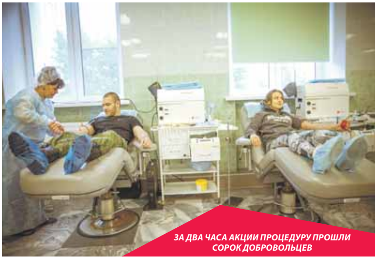
ЗА ДВА ЧАСА АКЦИИ ПРОЦЕДУРУ ПРОШЛИ СОРОК ДОБРОВОЛЬЦЕВ