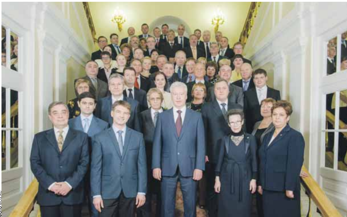
Фотография на память